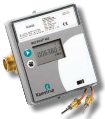
MULTICAL® 402 med gevindmåler

Nøjagtighedsklasse 2 eller 3, stort dynamikområde ( q_p/q_i 100:1) og den høje, permanente overbelastningsevne ( q_s/q_p 2:1) er standard.