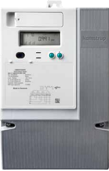
OMNIPower Üç fazlı