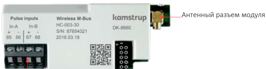
2 импульсных входа