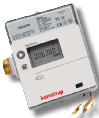
MULTICAL®402 mit Gewindezähler

Genauigkeitsklasse 2 oder 3, der große Dynamikbereich ( q_p/q_i 100:1) und die hohe dauerhafte Überlastbarkeit ( q_p/q_p 2:1) sind Standardeigenschaften von allen unseren Durchflusssensoren.