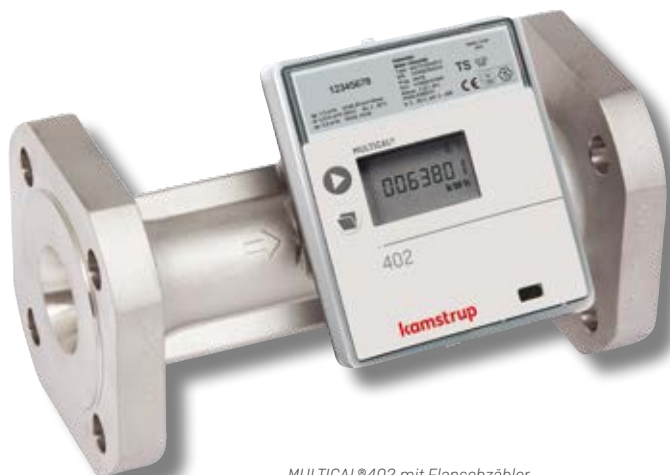
MULTICAL®402 mit Flanschzähler